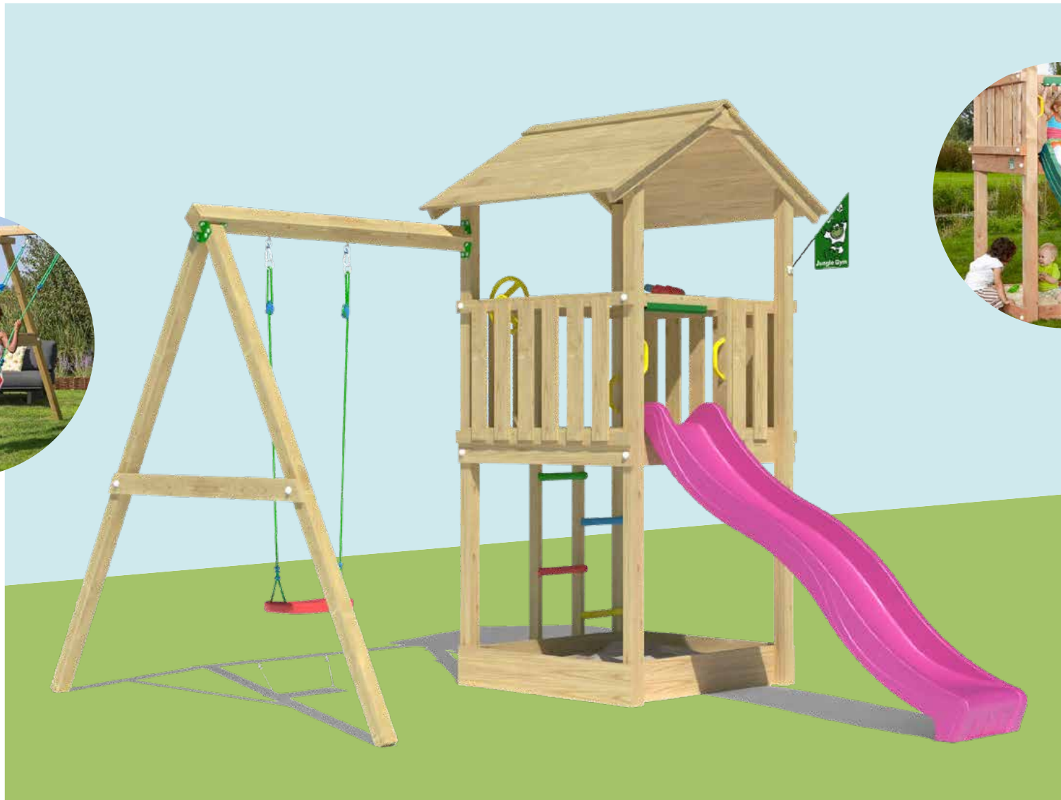
Abb. Beacon 1-Swing mit Rutsche XXL →