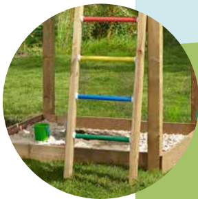
Abb. Lookout mit Rutsche XXL →