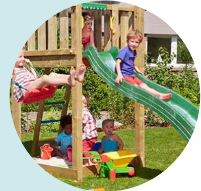
Abb. Canopy 2-Climb inkl. Rutsche XXL →